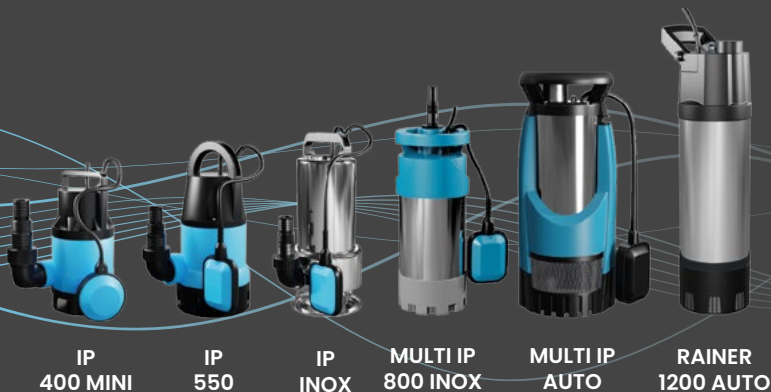
IP 400 MINI

pompy zasilane z wbudowaną automatyką ciśnieniową, dedykowane do wody deszczowej i podlewania ze studni kręgowych